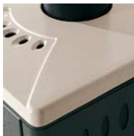
CERAMICA BIANCO PANNA CREAM WHITE CERAMIC