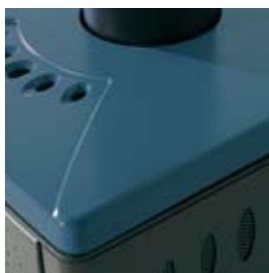
CERAMICA BLU MARE SEA BLUE CERAMIC