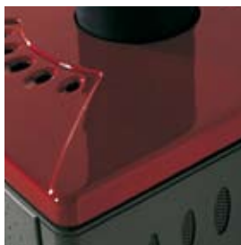
CERAMICA ROSSO BORDEAUX (CON CAVILLO) BORDEAUX CERAMIC (WITH CRAZING)

IN ADDITION TO THE CLADDINGS IN PHOTOS, ARE ALSO AVAILABLE: