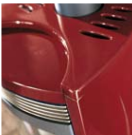
ROSSO BORDEAUX (CON CAVILLO) BORDEAUX (WHIT CRAZING)