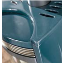
BLU MARE SEA BLUE