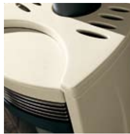
SALE E PEPE SALT AND PEPPER