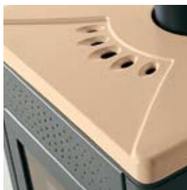
CERAMICA SABBIA SAND-COLOURED CERAMIC

IN ADDITION TO THE CLADDINGS IN PHOTOS, ARE ALSO AVAILABLE: