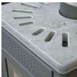
PIETRA OLLARE SOAPSTONE