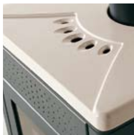
CERAMICA BIANCO PANNA CREAM WHITE CERAMIC