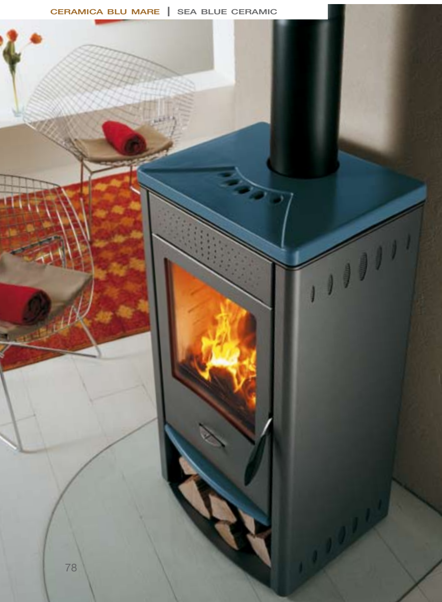
CERAMICA BLU MARE | SEA BLUE CERAMIC

** Volume riscaldabile a seconda del bisogno di 40-35-30 kcal/h per m 3 . Heatable volume based on needs of 40-35-30 kcal/h per m 3 .