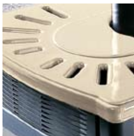
CERAMICA BIANCO PANNA CREAM WHITE CERAMIC

IN ADDITION TO THE CLADDINGS IN PHOTOS, ARE ALSO AVAILABLE: