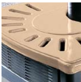
CERAMICA SABBIA SAND-COLOURED CERAMIC