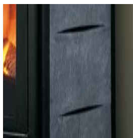
PIETRA SERPENTINO O PIETRA OLLARE SERPENTINE OR SOAPSTONE