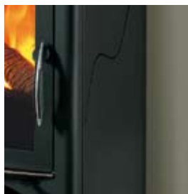
ACCIAIO VERNICIATO NERO BLACK PAINTED STEEL

IN ADDITION TO THE CLADDINGS IN PHOTOS, ARE ALSO AVAILABLE: