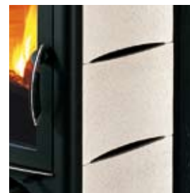
CERAMICA SALE E PEPE SALT AND PEPPER CERAMIC