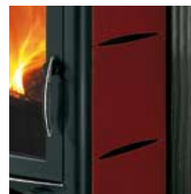
CERAMICA ROSSO BORDEAUX (CON CAVILLO) BORDEAUX CERAMIC (WITH CRAZING)